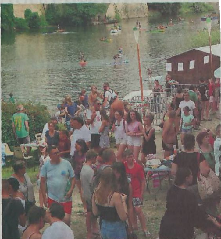
Une affluence record pour la 3e édition de la fête de l'eau.

Un partenariat gagnant-gagnant Au niveau du financement de la manifestation, les organisateurs sont également contents des résultats. « Nous avons un autofinancement de 88 % » rappelle David. « Et cette année, ce sont les commerçants à travers leur association qui nous ont apporté le ventrigrisse