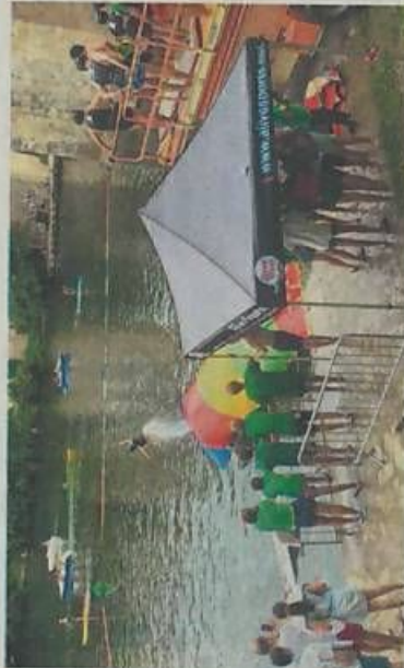
Le « blob jump » était l'une des animations de la Fête de l'eau.

ANIMATIONS Malgré une météo pas des plus favorables, la Fête de