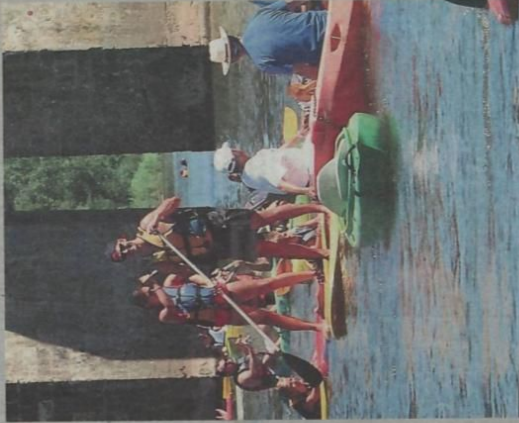
Embouteillage sur le Lot au pied du Pont Vieux construit par les Anglais entre 1282 et 1289.