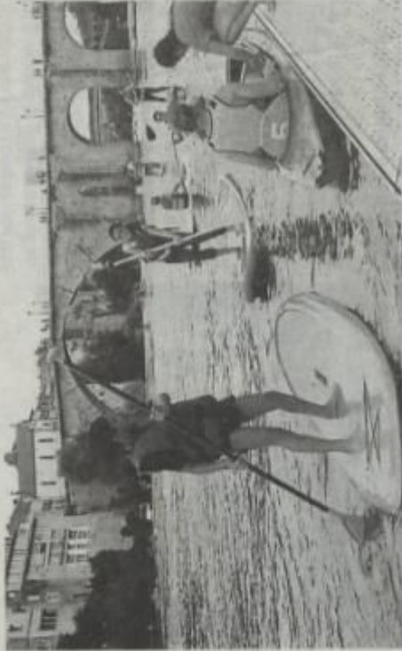
Du monde sur le Lot pour se rafraîchir.

Un temps légèrement cou-vert (mais sans aucun risque de pluie) a su attirer la foule des grands jours sur les bords du Lot, à la base nautique de l'aviron pour une fête de l'eau maintenant rentrée dans les habitudes de tous. Du blob-jump à la tyrolienne pour les plus téméraires, au paddle, du ventriglisse ou canoë pour les plus autres, chacun avait de quoi satisfaire ses envies de fraîcheur. Une journée placée sous le signe de la réussite, et de se donner rendez-vous autour de la rivière l'année prochaine. F.P.