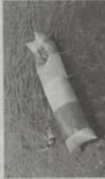
Le blob-jump, un bon moyen de s'envoyer en l'air.