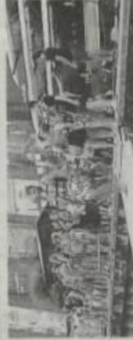
Près de 1 000 personnes sont venues pour la fête.