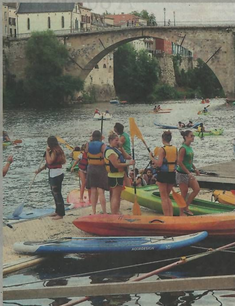
Villeneuvois et touristes se sont réapproprié le Lot et ses berges.