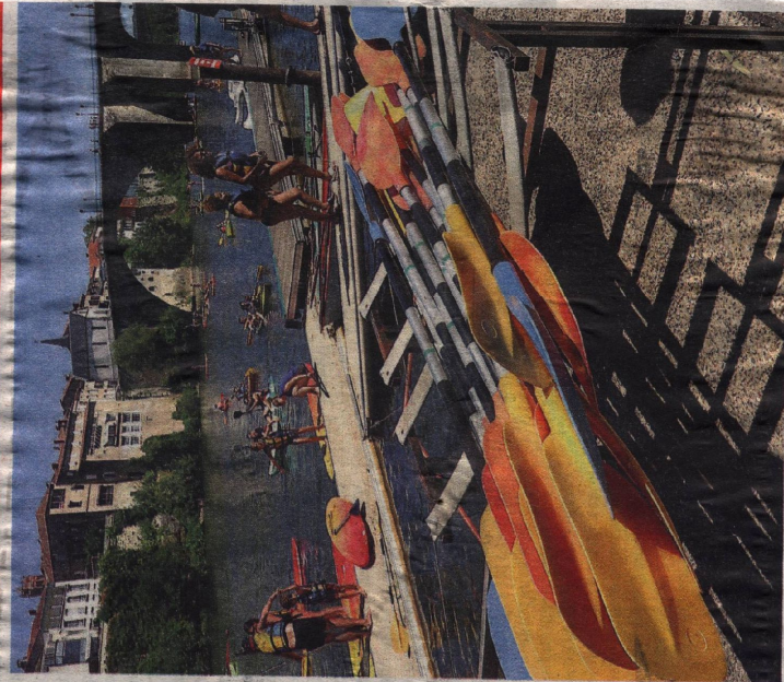
Les plaisirs nautiques sur la rivière en ce week-end ensoleillé.

Tél: 05 62 11 33 00 • contact@ladepeche.com • www.ladepeche.com