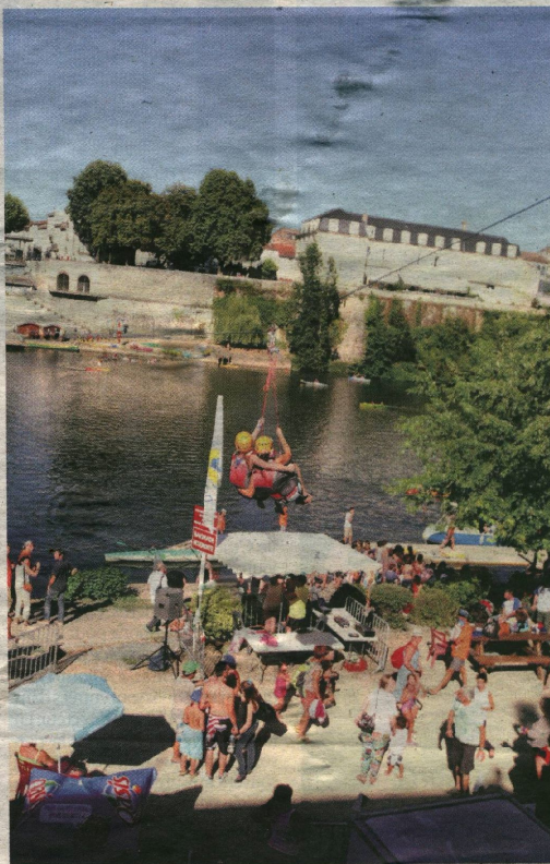
La tyrolienne avait cartonné l'année dernière.