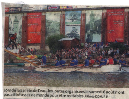
Lors de la 2e fête de l'eau, les joutes organisées le samedi 6 août n'ont pas attiré assez de monde pour être rentables.

LA FRÉQUENTATION DES SITES TOURISTIQUES ET MANIFESTATIONS