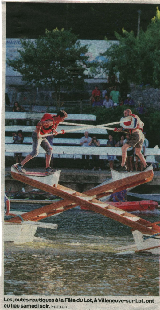
Les joutes nautiques à la Fête du Lot, à Villeneuve-sur-Lot, ont eu lieu samedi soir.

LUNDI 8 AOÛT 2016 - 1,10€ www.sudouest.fr