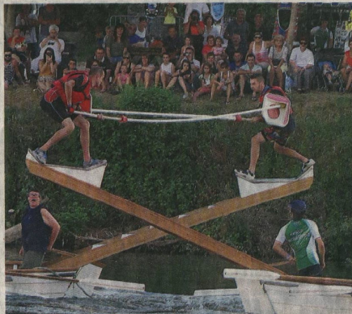
Les joutes attirent toujours un public friand de ces combats nautiques.