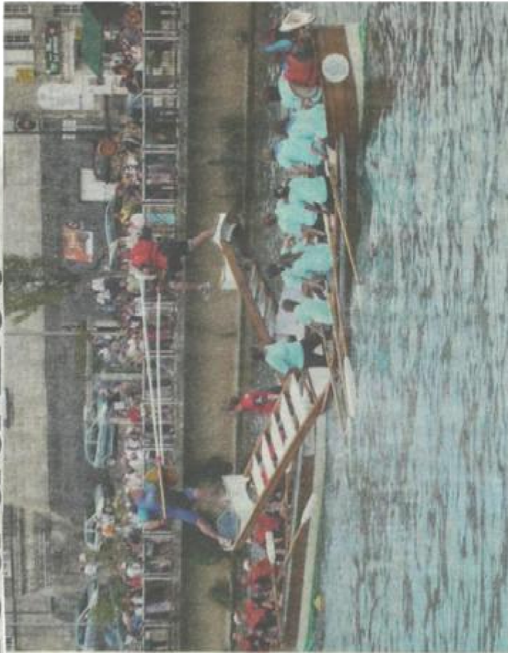
Les compétiteurs de joute nautique de Cognac viendront faire le show.